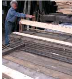
釘穴の方やワレなど、板の個性を見極めながらの材料選び。