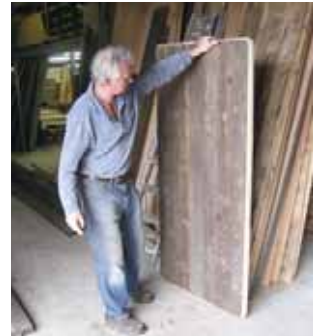
天板に接ぎ合わされた状態。これからサンディングにより独特の濃淡ある表情に仕上げられます。