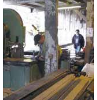
柱のような太い角材も、大型のバンドソーで製材されます。