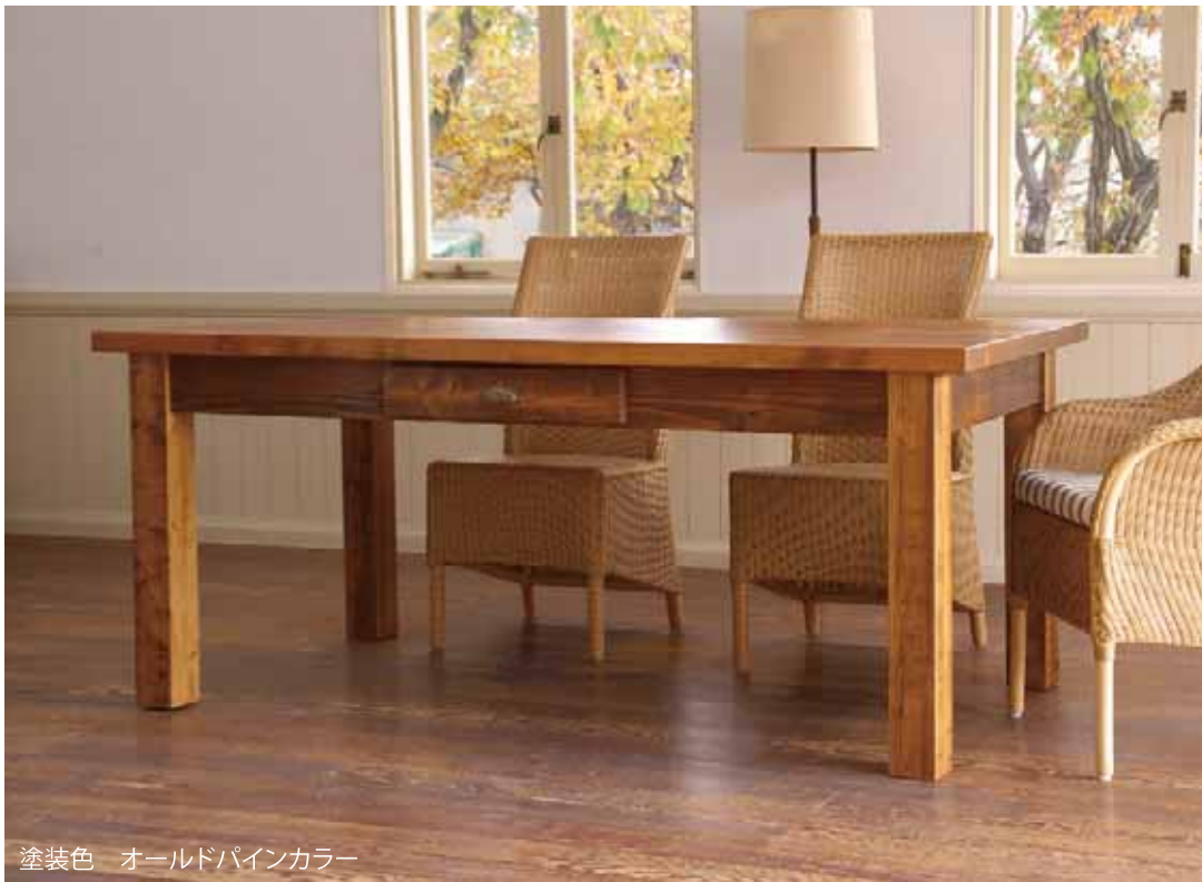
塗装色 オールドパインカラー

W2120 D910 H760 MPSQ84 ¥ 190,000 (消費税抜き)