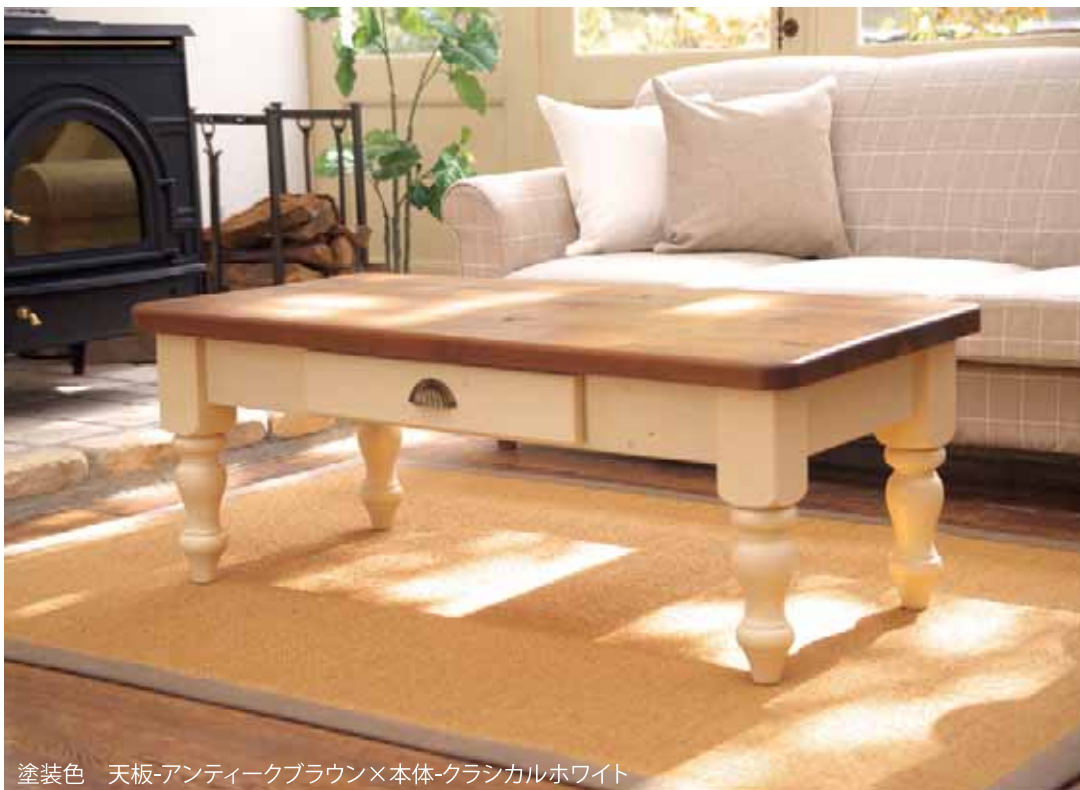
塗装色 天板-アンティークブラウン×本体-クラシカルホワイト

天板だけでなく、枠板、脚にも贅沢に古材を使っています。 脚のデザインは、アンティークを思わせる重厚かつ柔らかなスタイルに仕上げました。 古材の表情を生かすため、一律でなく板によりサンディングの具合を調整しています。