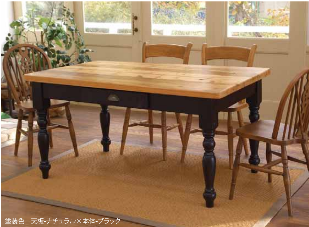
塗装色 天板-ナチュラル×本体-ブラック