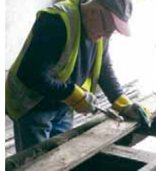
古材の中に残っている釘を、一本一本手作業で取り除きます。