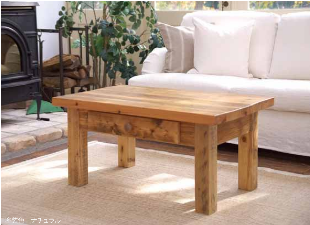
塗装色 ナチュラル

脚材には直径90mmの古材を使っています。脚は組み立て式です。天板と枠板は、天板の動きに対応できるように駒留めで固定されています。一部の構造材には堅木で補強も加え、外観や雰囲気だけでなく、長年安心してご使用いただける仕様になっています。